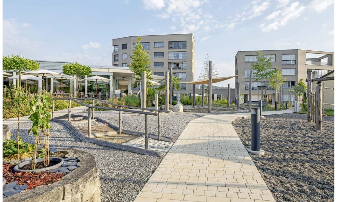
Seit knapp drei Jahren bietet das Schönbühl in den beiden Häusern «Ahorn» und «Linde» rund 22 Service-Wohnungen an, deren Angebot sich individuell auf die jeweilige Lebenssituation anpassen lässt.

Für ältere Menschen spielt Sicherheit im Alltag eine wesentliche Rolle und bestimmt die Lebensqualität mit. Die Mietwohnungen in den Häusern «Ahorn» und «Linde» sind deshalb mit einem Notruf-